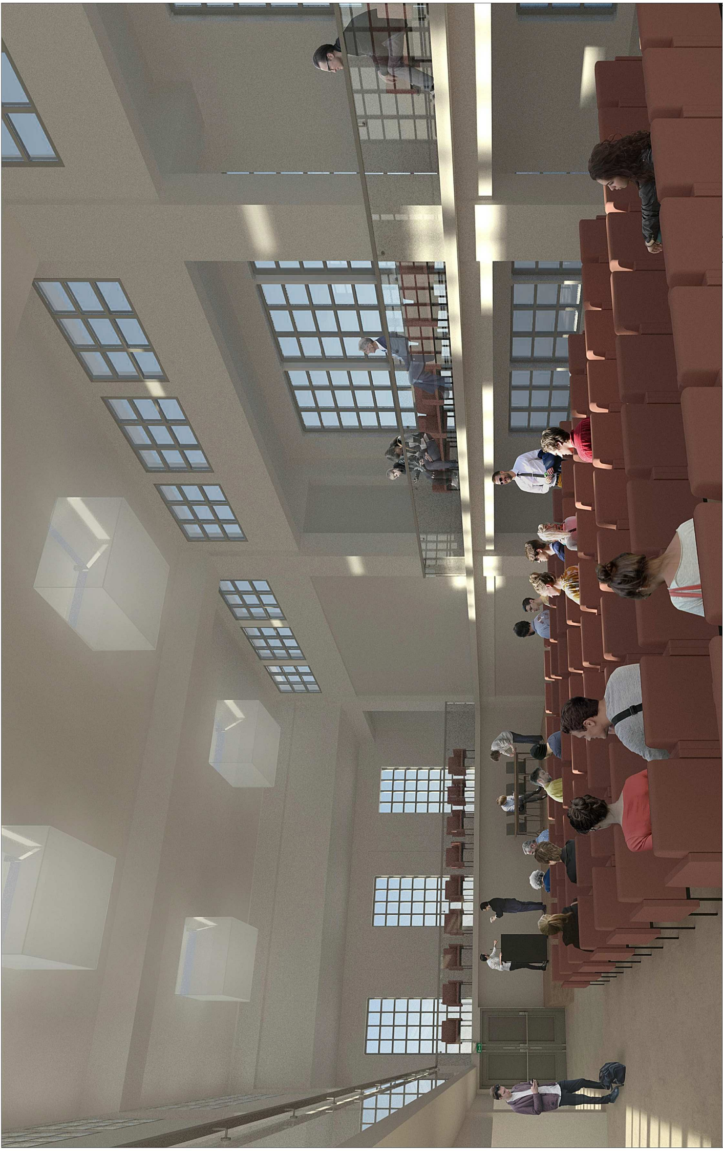
PERSPECTIVA DESDE PLANTA TERCERA DE SALÓN DE ACTOS Y TRASCORO

COLECCIÓN ARQUITECTURA C/ Blanco de Ocaña 41, 28222, Madrid Tlf: 91 545 53 66 Fax: 91 550 08 39