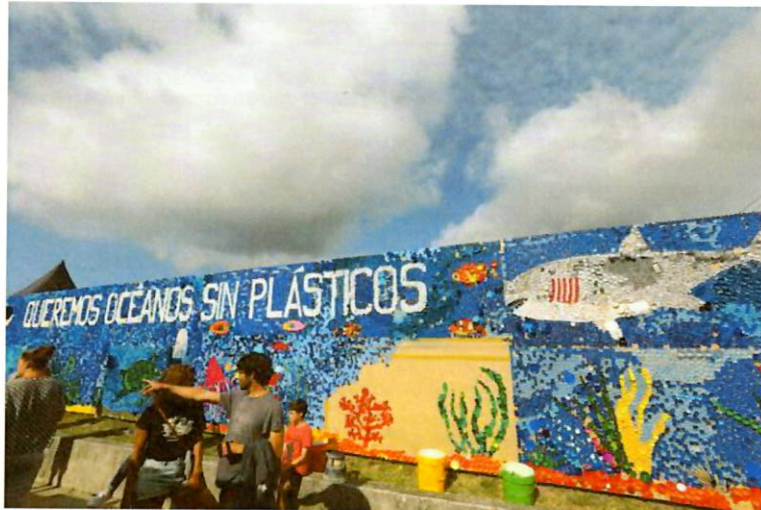
Imagen 5: Mural hecho con tapones en Salinas, Asturias.

3.1-. Creación en estos talleres de un mural en alguna fachada municipal céntrica con tapones reciclados que sirva de llamamiento turístico a la localidad y a su vez trate la temática del reciclaje y la sostenibilidad.