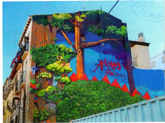
Imagen 2: Grafiti en "La Magdalena" en Zaragoza.