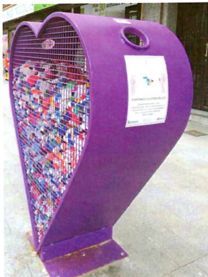
Imagen 3: Ejemplo cubo recogida tapones.

venta de este material como materia prima para la creación de mobiliario urbano.