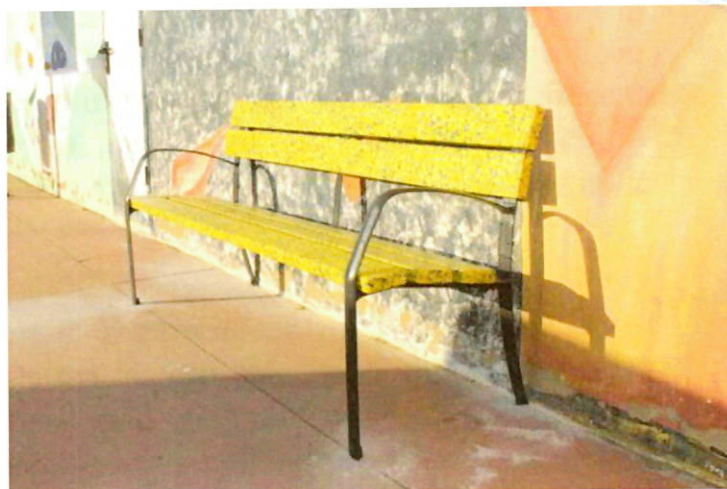
Imagen 4: Ejemplo mobiliario urbano hecho con tapones por CM Plastik.

Es por ello que desde nuestro Grupo Municipal Unidas Podemos Izquierda Unida Alcalá de Henares proponemos llegar al siguiente