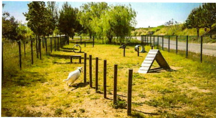
Imagen 2: Ejemplo circuito público agility para perros hecho con plástico reciclado. Sueca.

Esta iniciativa es un apelo más a la muy necesitada sostenibilidad en nuestra ciudad, dado que tras el reciclaje de este tipo de residuos se fabrica grana de polietileno, que tiene múltiples usos y aplicaciones prácticas (desde recipientes para alimentos y medicinas, dado que es inodoro y no tóxico, hasta uso en la construcción, donde a partir de la adhesión de pequeños moldes se pueden crear viviendas). Concienciar a los complutenses de la separación de estos residuos es educar en sostenibilidad.