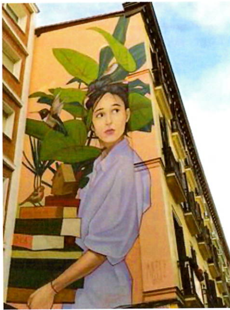
Imagen 1: Grafiti en la calle Fuencarral de Madrid.