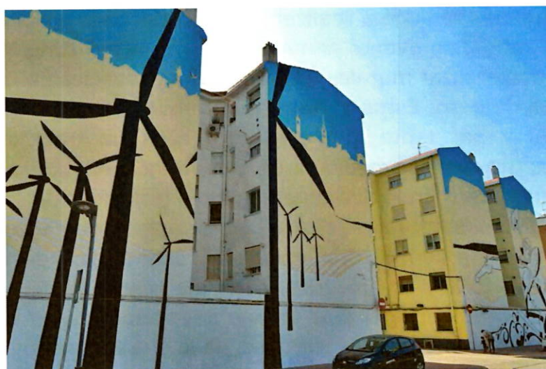
Imagen 5: Grafiti en Calles Torrelaguna y Gurugú en Alcalá de Henares.