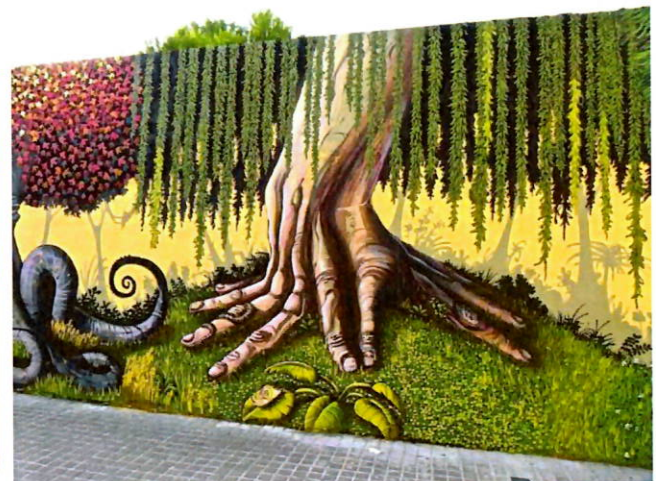
Imagen 3 y 4: Grafitis en el barrio "El Carmen" de Valencia.

La promoción del arte urbano en Alcalá de Henares es una gran iniciativa que no sólo sirve para restaurar espacios municipales (fachadas, muros de edificios, puentes subterráneos) y darles una estética nueva y limpia. Sino que supone la apertura de una puerta a la participación de los vecinos y vecinas, sobre todo los más jóvenes en el proceso. Es la forma de restauración más asequible, ya que bastaría con la cesión de estos espacios municipales a artistas (como se hizo con el mural feminista), a asociaciones juveniles (como podría ser el CAJE) u otros tejidos asociativos. No obstante, nuestra propuesta va más allá: queremos que la creación de murales consiga cohesión social: integración de los jóvenes en la ciudad, conociendo a través de la pintura la historia de Alcalá de Henares o los hechos importantes en su propio barrio. El hecho de que los jóvenes