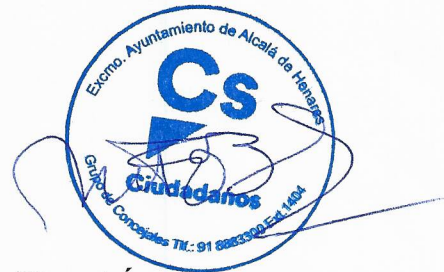
Fdo.: D. Miguel Ángel Lezcano López Portavoz Grupo Ciudadanos Excmo. Ayuntamiento de Alcalá de Henares