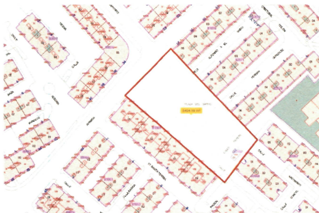
Delimitación de la zona afectada

De las reuniones mantenidas en los barrios con nuestros vecinos hemos comprobado la necesidad de dignificar diferentes espacios hoy deteriorados en nuestra ciudad. Uno de ellos es la Plaza del Barro, que se encuentra situada entre las calles Doncel, Arzobispo Carrillo y Avenida Reyes Católicos, con una superficie de aproximadamente 6.400 metros cuadrados.