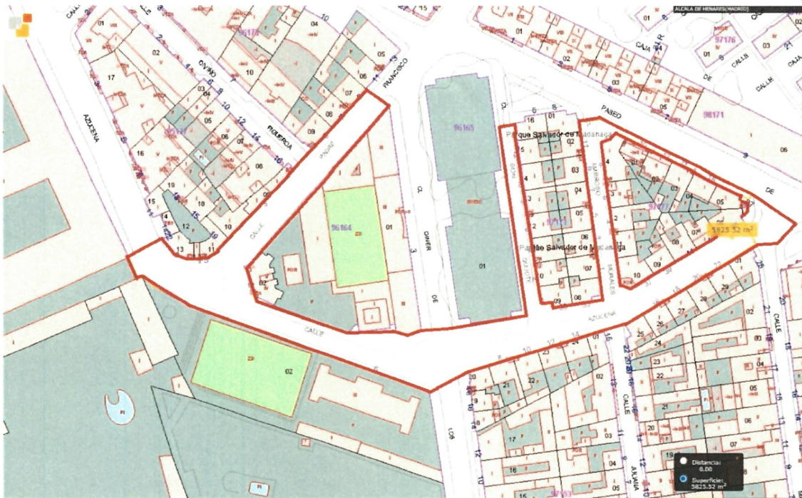
Delimitación de la zona afectada

Documento firmado electrónicamente. Copia electrónica auténtica de documento papel - CSV: 13527262621135562431